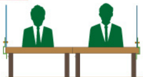
2人グループ (2テーブル)