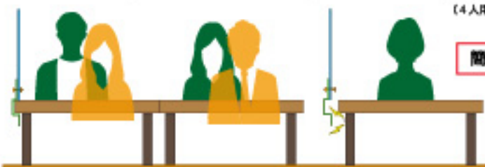
4人グループ (2テーブル)