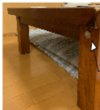
ベット板 強力マグネット